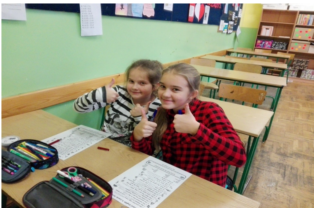
Zajęcia z j. angielskiego w kl. VI