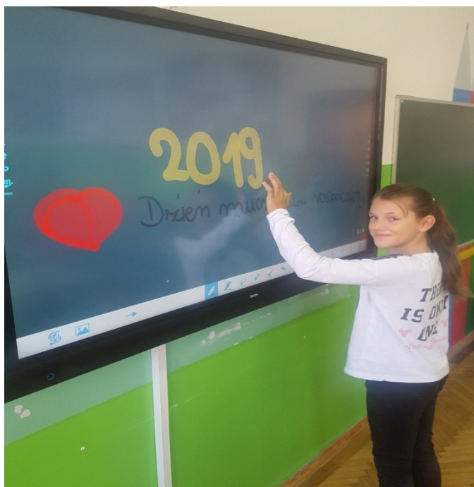
Zajęcia z j. angielskiego w kl. V