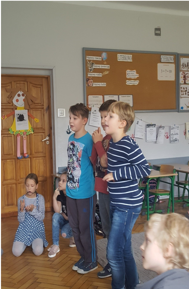
Zajęcia z j. angielskiego w kl. II i III